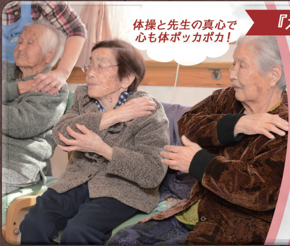
体操と先生の真心で 心も体ポッカポカ!