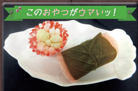
このおやつがウマイッ!