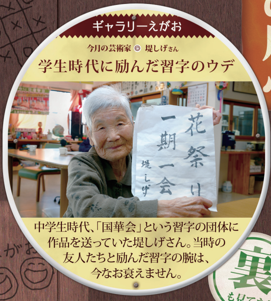
ギャラリー-えがお

3月4日のおやつは、桜もち。スタッフが利用者様の前で、一つ一つ丁寧に生地を焼いて作りました。桜の季節には少し早いですが、一足早く春の訪れを感じられるおやつとなりました。