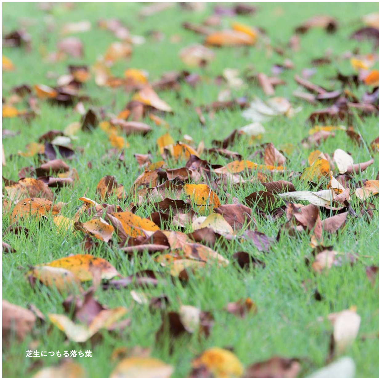
芝生につもる落ち葉