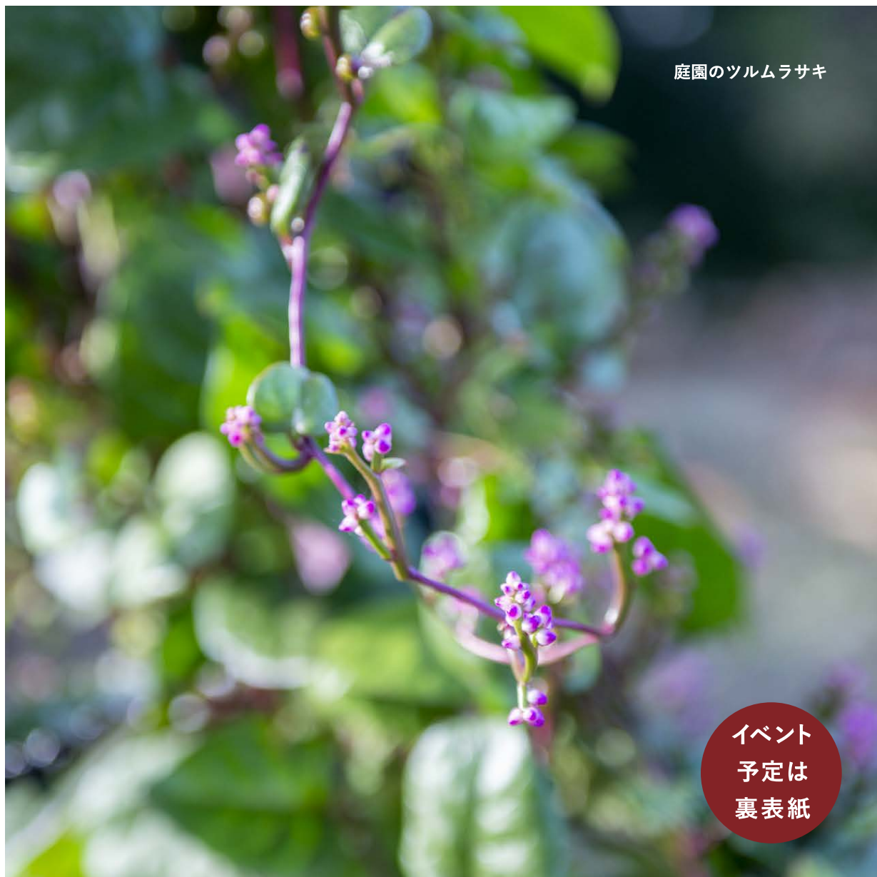
庭園のツルムラサキ