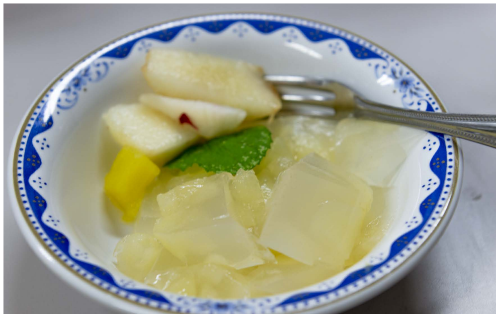
今年も『えがお』産の桃を使ったゼリーを作りました！