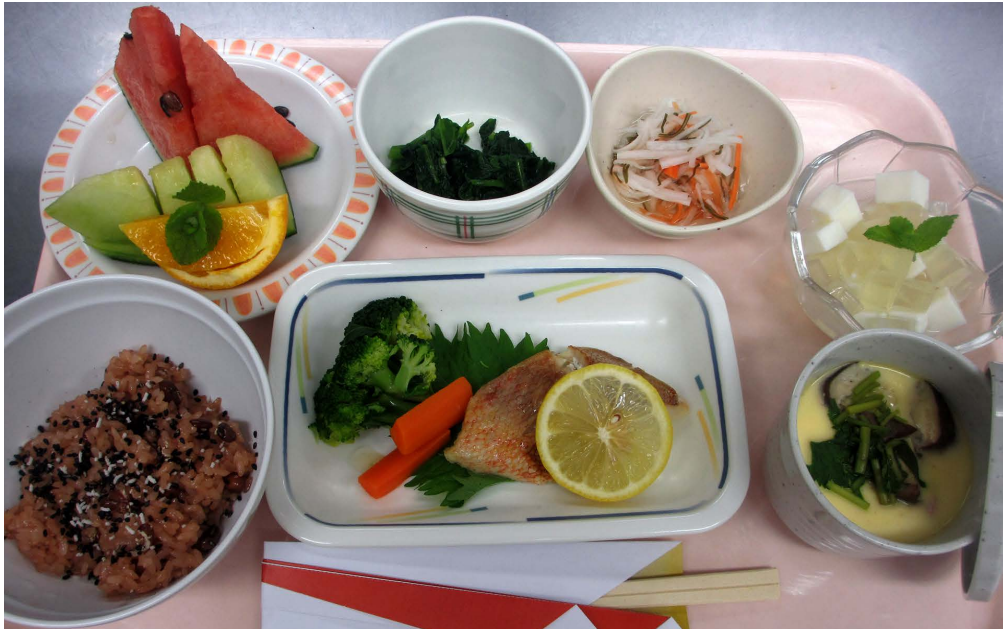
13周年特別メニュー。赤飯にタイにミカンに、縁起の良い食べ物がたくさん。