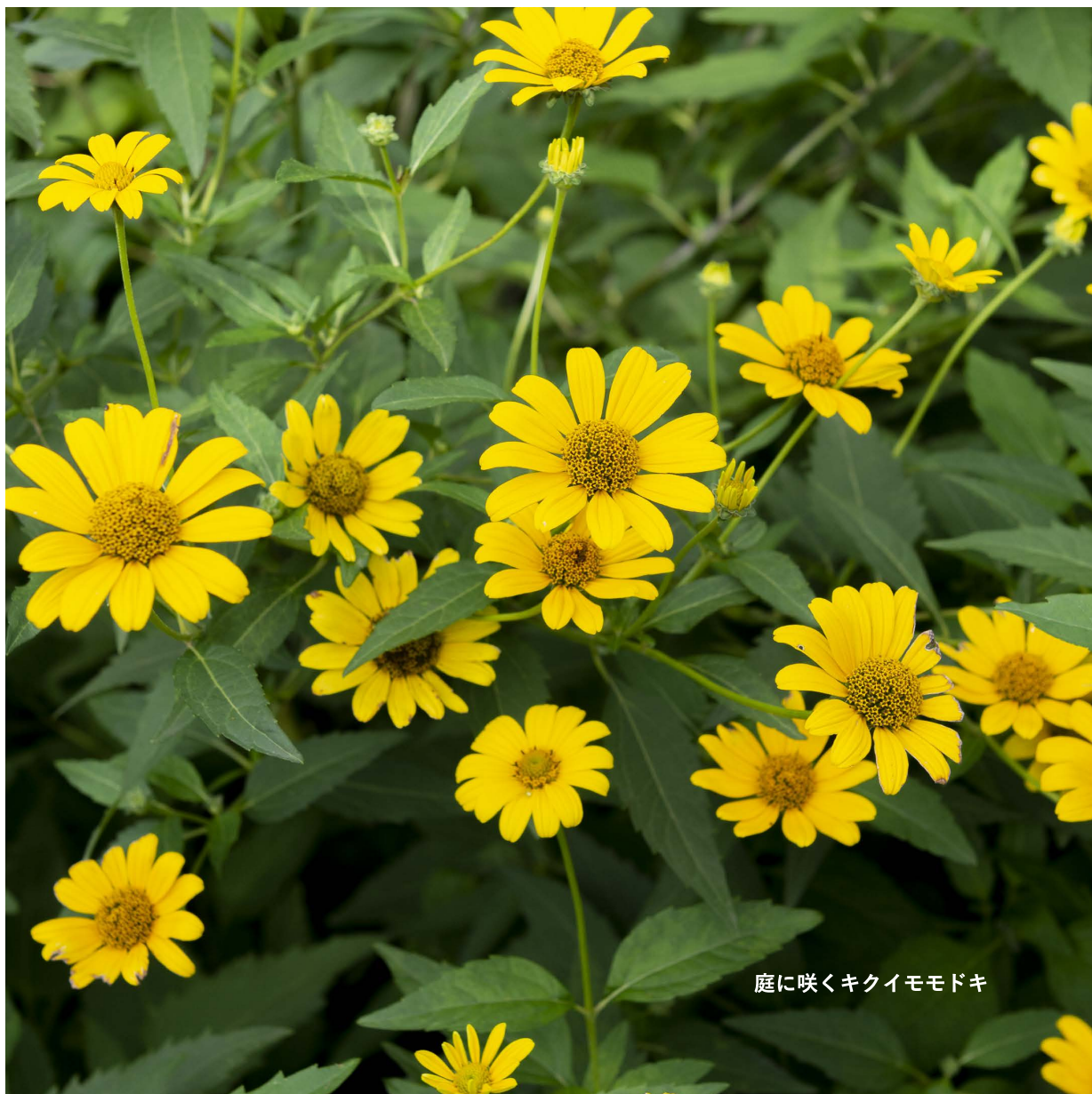
庭に咲くキクイモドキ