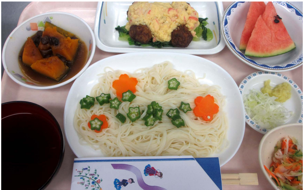
七夕特別メニューのそうめん。オクラとニンジンで作った天の川に注目！