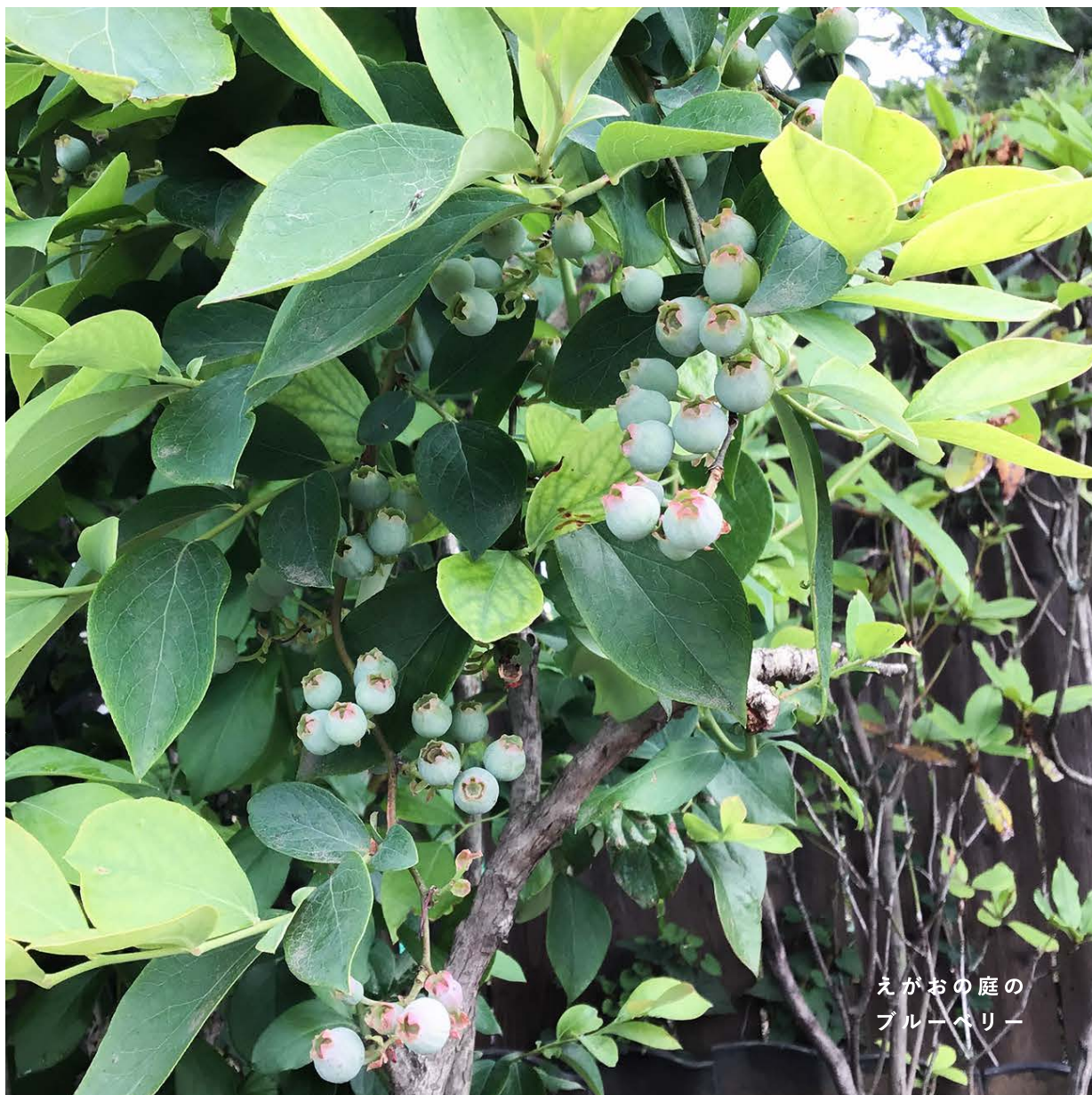
えがおの庭の ブルーベリー