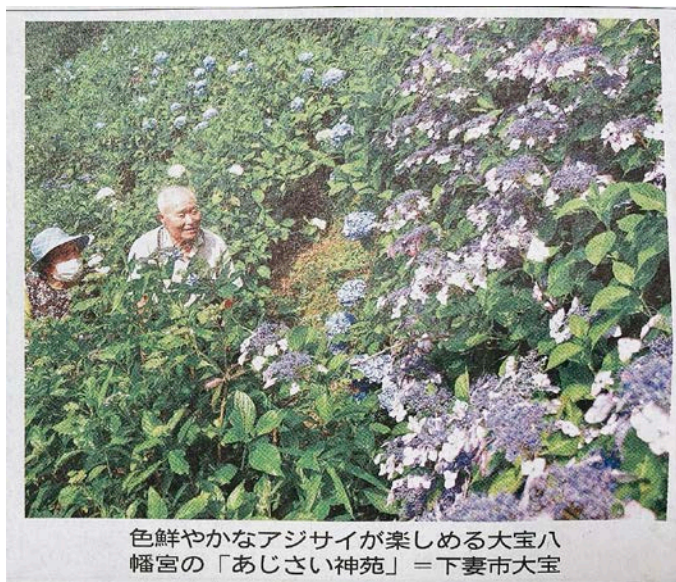
色鮮やかなアジサイが楽しめる大宝八幡宮の「あじさい神苑」＝下妻市大宝

大宝八幡宮のあじさい神苑を訪れた際、利用者様やスタッフが、茨城新聞からの取材を受けました。めったに無い機会に、みんな緊張気味だったかもしれませんが、そんな気持ちも含めて新鮮な経験でした。茨城新聞 2021年6月18日の朝刊に掲載されていますので、ぜひチェックしてみてください！