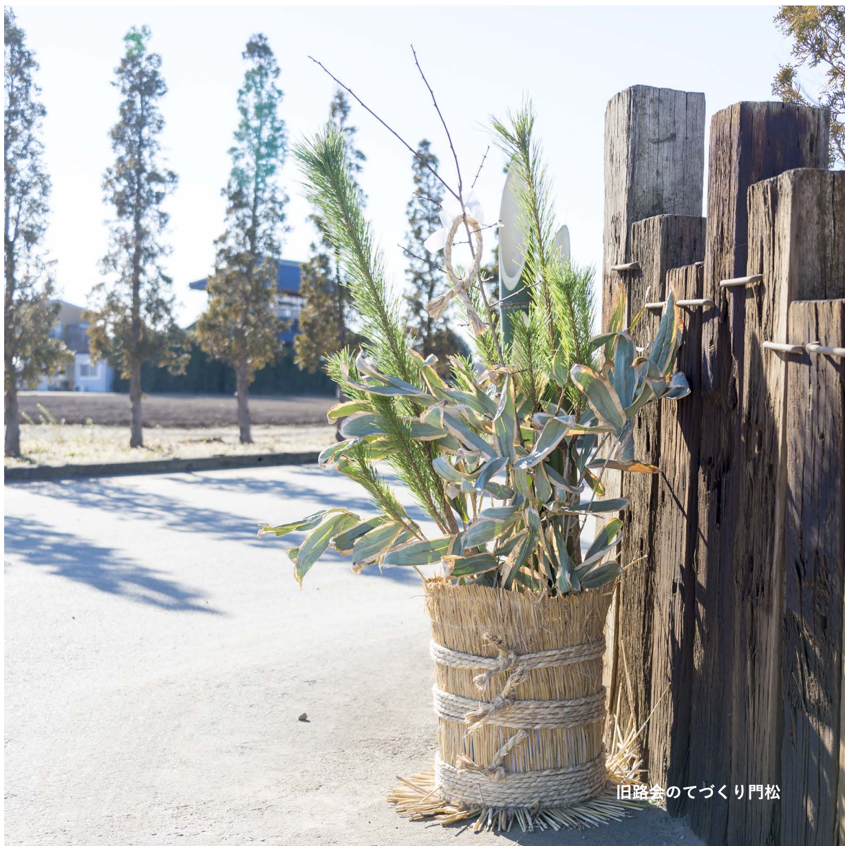
旧路会のでづくり門松