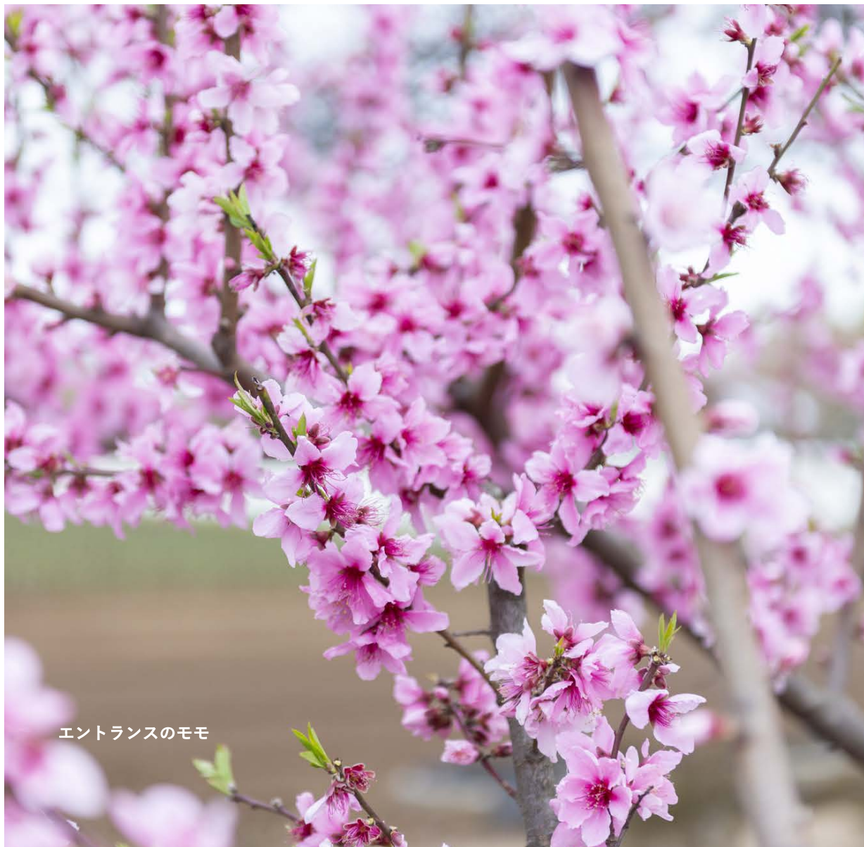
エントランスのモモ