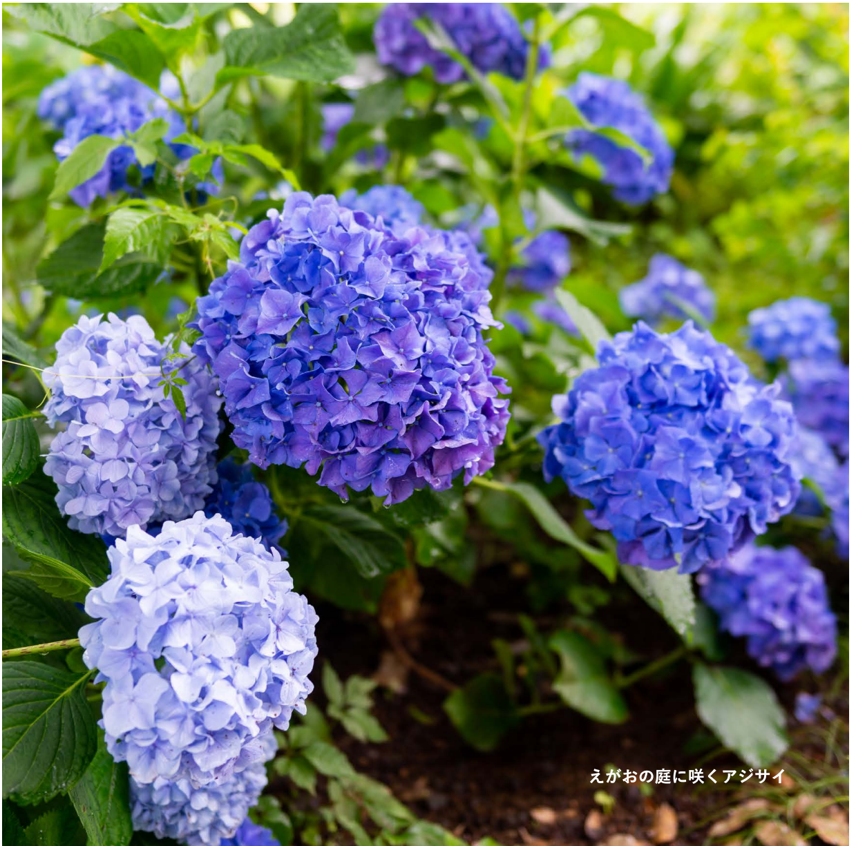
えがおの庭に咲くアジサイ