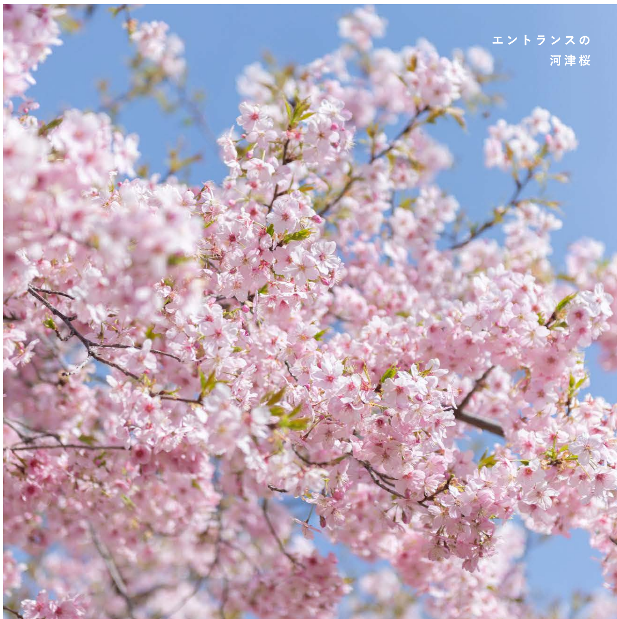
エントランスの 河津桜