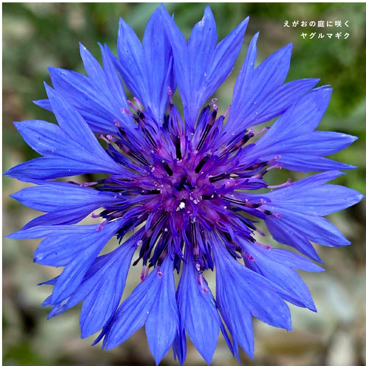
えがおの庭に咲く ヤグルマギク